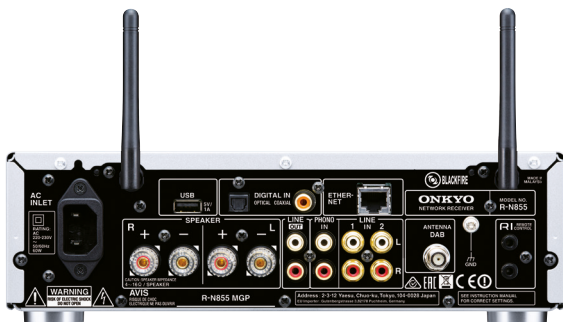
R-N855(S) – Rückansicht

*Nicht im Lieferumfang des chinesischen Modells enthalten.